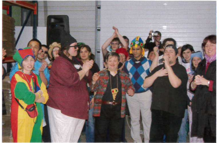
L'équipe de l'ESAT PEP21 esat@pep21.org

En attendant l'année prochaine pour renouveler ce moment si convivial !! ■